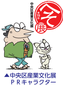
▲中央区産業文化展PRキャラクター

10月3日、中央区観光商業まつりがスタートし、11月7日まで区内一円で商店街や百貨店などが秋の中央区の魅力を味わえるさまざまなイベントを実施します。オープニングイベントでは会場に集まった皆さんに区内商店街の名産品が手渡され、多くの方でにぎわいました。