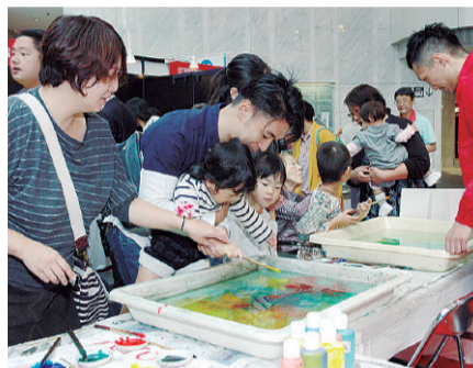
▲第18回中央区産業文化展の様子