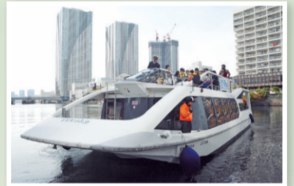
▲イベント当日、船を無料運航します