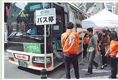
▲イベント当日、バスを無料運行します