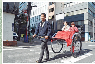
▲人力車体験ができます