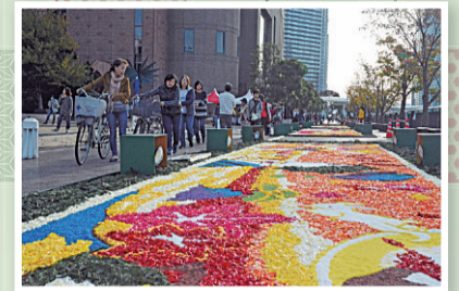
▲フラワーカーペットの様子