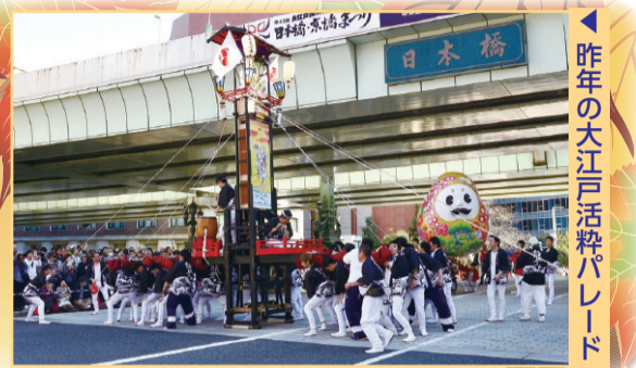
昨年の大江戸活粋パレード