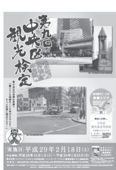
▲観光検定ポスター