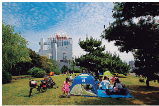
▲平成27年推薦作品「海上公園」

原簿を提出していただきます。 指定期日までに原簿の提出がない場合、入賞を取り消すことがあります。 入賞作品の著作権・著作権は中央区観光協会に帰属します。 入賞作品は、展示およびホームページ、出版物などに無償で使用します。 ◎注意事項の詳細は、中央区観光協会ホームページをご覧ください。 応募方法 11月4日(必着)までに郵送