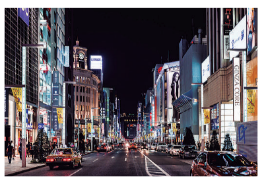
▲平成27年入選作品「現代の江戸」

4月1日から8月14日生まれた方には、9月末に「予診票」お知らせ、医療機関名簿を一斉発送します。以降は、生後2カ月に達するまでに発送します。 接種方法 予診票に必要事項を記入し、母子健康手帳を持参の上、23区内の指定医療機関で無料接種できます。 ◎医療機関によっては、予約が必要な場合がありますので、事前に電話で確認してください。 中央区保健所健康推進課予防係 ☎(3541)5930