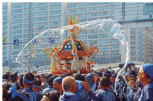
▲平成27年特選作品「シャワータイム」

接種回数 3回 接種間隔 27日以上の間隔において2回接種した後、1回目の接種から139日(約20週)以上の間隔をおいて3回目を接種する。 標準的な接種期間は、生後2カ月から9カ月に達するまで 予診票などの送付時期