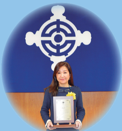
エヌアイシー・ソフト株式会社

区では、仕事と家庭の両立支援や男女ともに働きやすい職場づくりなど、ワーク・ライフ・バランス(仕事と生活の調和)の推進に取り組んでいる事業所を認定しています。4月11日(月)に認定式が行われ、別表の事業所を認定し、顕彰しました。☎総務課女性施策推進係 ☎(5543)0651