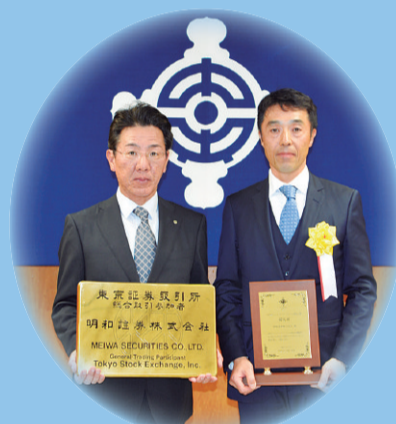
明和証券株式会社