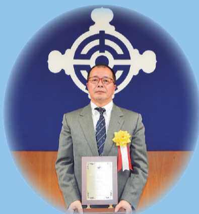
日光ケミカルズ株式会社