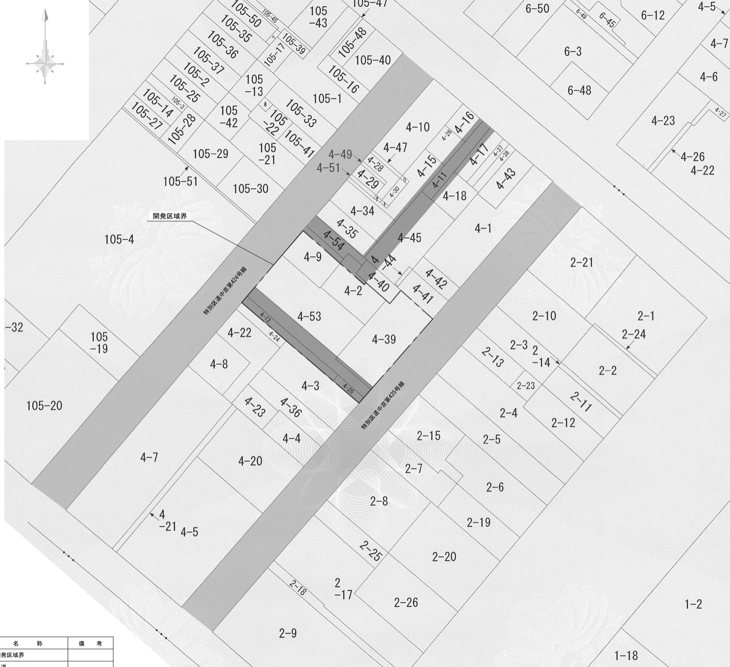
公共施設の管理者等に関する一覧表