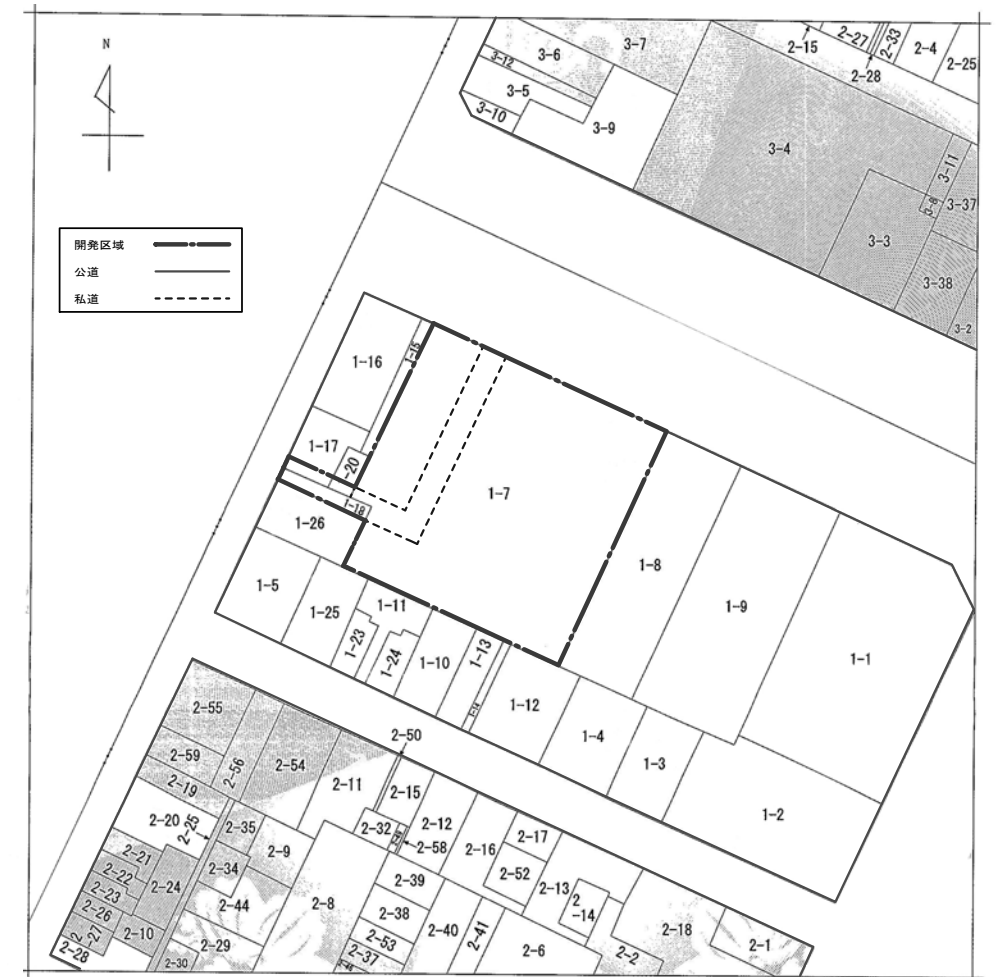
公図 : 1/1200