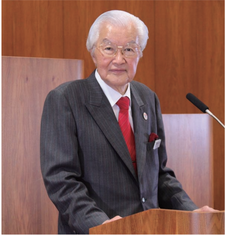
中央区長 矢田 美英

中央区ホームページ http://www.city.chuo.lg.jp (「区のおしらせ 中央」もご覧いただけます)