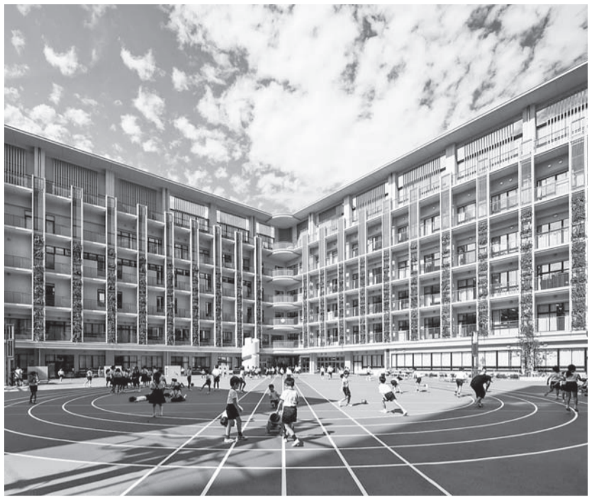
▲区立明正小学校・幼稚園(平成26年9月竣工)

券を発行します。加えて、国の緊急経済対策を受け、一層の消費喚起を図るため、中央区商店街連合会(区商連)による2億4千万円のプレミアム付商品券の発行を支援いたします。 都市観光の推進では、区内のあらゆる観光情報の整理・集約や多言語対応など、京橋二丁目を整備を進めている「観光情報センター」を核とした魅力的な情報発信のためのコンテンツづくりに取り組んでいます。また、本区ならではの「おもてなし」を一層推進するため、文化財サポーターなどを対象とする外国語研修を新たに実施し、国内外からの来訪者と直接ふれあいがら本区の魅力をアピールするボランティア人材の育成を図ります。 地域に根ざした文化の振興に向けては、これまで認定した22の「まちかど展示館」を観光・文化資源として有効に活