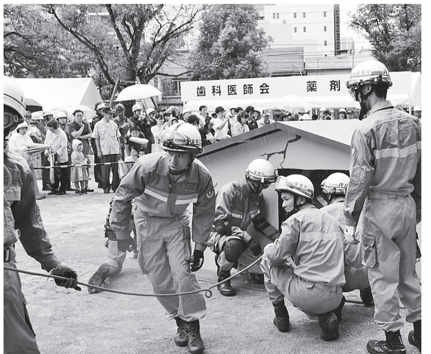
▲中央区総合防災訓練

次に、快適な区民生活と活発な事業活動を支える都市基盤整備についてであります。まず、防災性の向上やにぎわいの再生をはじめとするさまざまな地域課題の解決に寄与するため、湊二丁目東地区、銀座六丁目地区、日本橋二丁目地区、月島一丁目西仲通り地区など、7つの市街地再開発事業に対する助成を行います。基幹的交通システム「BRT」の導入については、東京都が主体となって推進していく方針が示されましたが、運行経路や開始時期など本区がこれまで重ねてきた検討の成果が反映されるよう都と協議を続けてまいります。都市交通の抜本的な課題解決のための地下鉄新規路線の導入については、今年度の実施した調査検討の成果をもとに、建設・運行計画や事業主体、収支採算性などの課題を整理し、必ずや実現させるという強い意気込みを持って関係機関への働きかけを行います。また、区内における放置自転車の解消を目指し、東京駅周辺に続いて銀座地区などにおいて民間事業者を活用した駐輪場を整備するとともに、本年4月からの駐輪場使用料の有料化