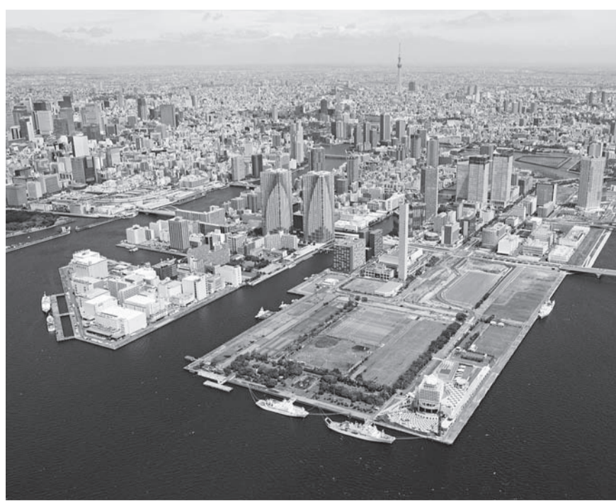
▲上空から望む晴海地区

地市場跡地の活用」であります。23ヘクタール、約7万坪の広大な跡地は、都心の最後の貴重な公有地であり、その活用は本区のまちづくりを大きく左右することとなります。東京都知事からの呼びかけに応じ、さらなる連携を図りながら、本区はもとより、東京、日本が世界に誇れる新たな名所として、多くの人が集い、にぎわう計画となるよう取り組んでいかなければなりません。さらに、長年の悲願である名橋「日本橋」を覆う高速度路の撤去と川岸の景観整備についても、2020年大会を