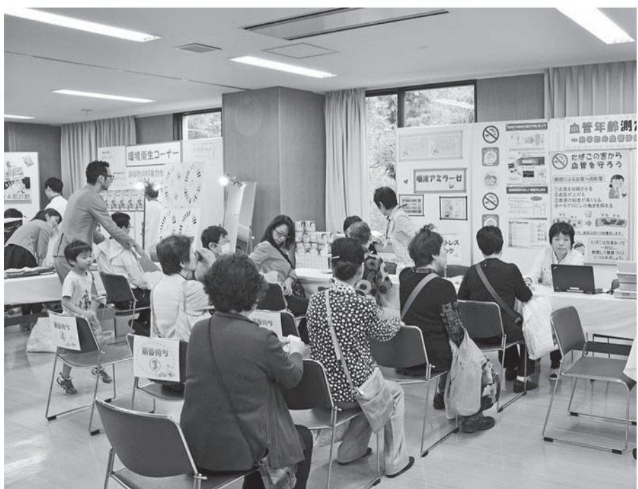
▲中央区健康福祉まつり

その結果、新規事業は22、充実事業は49で、臨時福祉給付金の支給などを含む一般会計総額は、前年度比9.6パーセント増の910億7100万円余と、過去最高となっております。