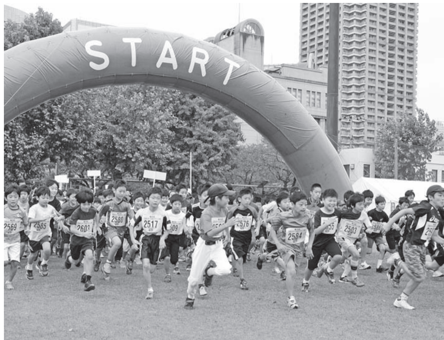
▲区民スポーツの日

道を示していく意義を持っており。大会の中心となる選手村を擁する本区としても、国や人種、宗教の違いを越えて、一人ひとりを等しく尊重し合う友愛の精神、寛容の心を子どもたちに育むため、国際教育、平和教育を一層推進し、「世界の恒久平和」へのメッセージを力強く発信してまいります。そして、この機を本区のみならず躍進への絶好のチャンスと捉え、その先の将来を見据えつつ、都市交通や公共施設などの基盤整備、商工業や都市観光の振興など、区内全体の良好なまちづくりを一段と弾みを付け、区民の皆さまが「快適な都心居住」を謳歌し、本区に集まる全ての方々が豊かさを享受することができ「わがまち中央区の黄金時代」を築き上げてまいります。