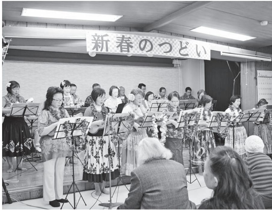
▲いきいき桜川(桜川敬老会) 新春のつどい

4年生・5年生を対象に「子どもの得意スポーツ発見事業」を実施するとともに、国民健康保険事業における特定保健指導の受診者に歩数計を配布し、40歳以上の方々の運動の習慣化を支援します。さらに、さわやか健康教室をはじめとする区の事業や地域団体による健康づくり活動、区内の運動施設などの情報をまとめたパンフレットを作成し、早くから介護予防に取り組むためのきっかけを提供してまいります。