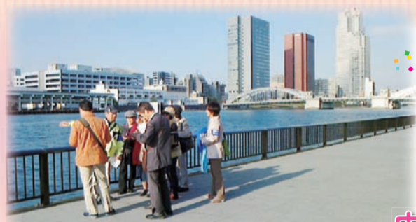
写真は平成26年度中央区民カレッジの様子