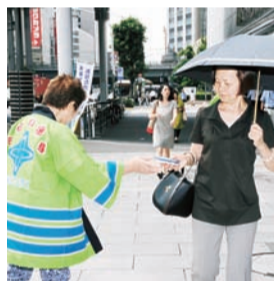
▲区ではさまざまな選挙啓発活動を行っています