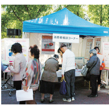
▲ 昨年の中央区消費生活展

赤い羽根共同募金中央地区協力会 (中央区社会福祉協議会管理部内) ☎(3206)0506 日本橋特別出張所地域活動係 ☎(3666)4251 月島特別出張所地域活動係 ☎(3531)1151 生活支援課地域福祉係 ☎(3546)5348