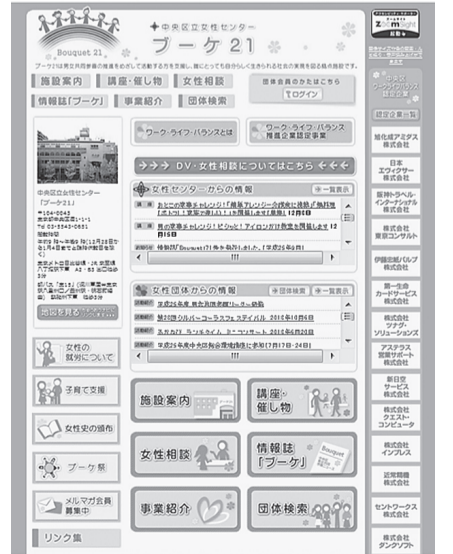
▲女性センター「ブーケ21」のホームページ

凡例 日時 会場 対象 内容 定員 費用 申込方法 問合せ(申込先) HP ホームページアドレス Eメールアドレス