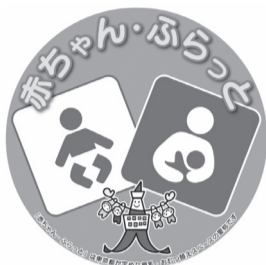
▲赤ちゃん・ふらっとマーク

◎来所される場合はあらかじめご連絡ください。 子ども家庭支援センター相談係 ☎(3534)2255 く児童虐待に対応するため「子どもほっとライン」