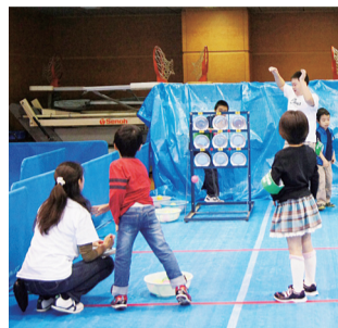
▲昨年の子どもフェスティバル