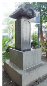
▲森孫右衛門 供養塔

決定通知方法 開催日の7~9日前までに、返信用はがきまたはメールで参加の抽選結果を通知します。 ☎104-0061 中央区銀座1-25-3 京橋プラザ3階 中央区観光協会「まち歩きツアー」係 ☎(6228)7907 HP http://www.chuo-kanko.or.jp