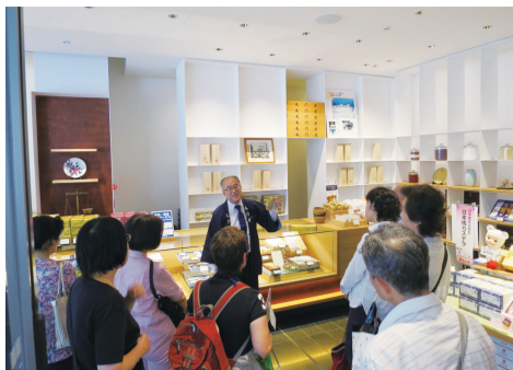
▲「産業コース・老舗コース」の様子

9月7日、月島地域で総合防災訓練が実施されました。各防災拠点では、避難所開設・運営訓練が行われ、月島第二児童公園では、実際の車両を使い閉じ込められた人の救出や、高層住宅からはしご車を使い救出するなどの迫真の訓練が行われました。雨の中、参加した皆さんは災害に備え真剣に取り組まれました。