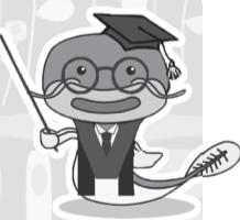
中央区耐震促進キャラクター「ナマちゅう」

●当日参加もできます。 建物の耐震診断や耐震補強工事などへの助成 平成28年3月31日までの間に耐震補強工事の助成金交付申請を行い、耐震補強工事の完了報告をする住宅系用途の建築物について助成制度を拡 ☎(3546)5459 FAX(3546)9551