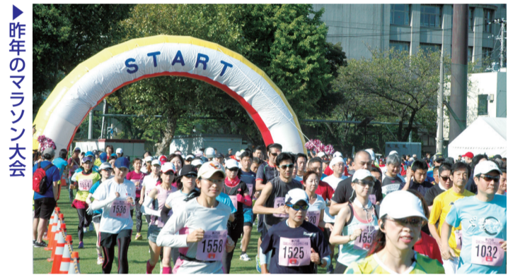
▶ 昨年のマラソン大会

多くの方にスポーツを楽しんでいただくため、マラソン大会をはじめ、子どもから大人まで幅広く一緒に参加できる各種イベントを行います。