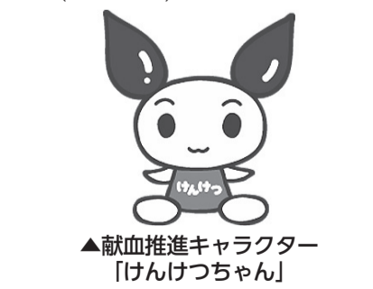
▲献血推進キャラクター「けんけつちゃん」

区では、慢性的な血液不足対策のため、集団献血を定期的実施しています。 ぜひ、ご協力をお願いします。 日 8月15日(金) 午前10時～11時40分、午後1時～4時 場 区役所8階大会議室 ◎200ミリリットルおよび400ミリリットルの全血献血を行います。 ◎輸血の安全性確保のため、受け付けの際、献血者の本人確認を行っています。お手数ですが献血会場に氏名を確認できるもの(運転免許証、パスポート、健康保険証など)をご持参ください。 ◎直接会場へお越しください。 ◎年齢、海外渡航、服薬などによりご協力いただけない場合があります。詳しくは実施機関にお問合せください。 【実施機関】 東京都赤十字血液センター ☎(5534)7550