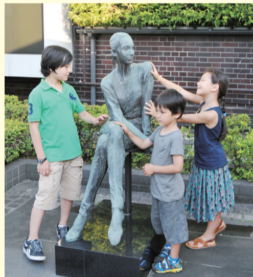
▲平和像「ニコラ」(区役所前)

8月15日は69回目の終戦記念日。この日を迎えるにあたり、あの忌まわしい戦争を憎み、二度と再び繰り返してはならないとの「不戦の誓い」を新たにせずにはいられません。 この思いを内外へ厳粛に表明するのが、天皇・皇后両陛下御臨席のもと正午前から日本武道館で挙行する「全国戦没者追悼式」です。また、東京都は文京シビックホールで戦没者追悼式を実施するなど全国各地でさまざまな催しが行われます。区内では、小伝馬町一の部町会が十思公園で「石町の鐘を撞く会」を開催します。中央区社会福祉協議会と遺族会は7月2日、築地本願寺で孟蘭盆法要を共催し、戦没者・戦争殉難者のご冥福をお祈りしました。 一方、6日には広島市で、9日には長崎市で原爆死没者慰霊式・平和祈念式が開かれます。唯一の被爆国であり、核兵器廃絶を目指すわが国にとって象徴的式典です。首相、衆参両院議長をはじめ各国の駐日大使ら代表も列席します。こうした平和への願いや努力にもかかわらず、世界的に見ると、平和を脅かす危険な状況や紛争の、何と多いことでしょうか。北朝鮮は現時点(7月17日)までに、今年に入っですでに5回にわたり短距離弾道ミサイルを日本海に発射しました。昨年2月には国際世論を無視して3度目の核実験を強行しました。 こうした暴挙は一般国民の支持により決定されているのでは決してありません。かつて、共同通信社記者として訪朝した経験のある私にとって、一般市民との出会いの数々からはとうてい考えられないくらいです。北朝鮮に限らず、一部の指導者により決定される恐ろしさがここにあるのです。自由と民主主義の尊さをあらためて感じております。 6年後には世界最大・最高の「スポーツと平和の祭典」オリンピック・パラリンピックが東京にやってきました。その時にこそ、繁栄に満ちた平和な国家日本は戦後一貫して平和を希求してきた結果であることを強くアピールし、平和への道をリードしていこうではありませんか。平和な世は必ずくるのですから――。