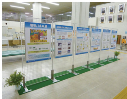
▲昨年の環境パネル展

6月5日は「世界環境デー」です。これは1972年にストックホルムで開催された「国連人間環境会議」を記念して定められたものです。 日本では、この日を「環境の日」、6月の1カ月間を「環境月間」とし、環境についての関心と理解を深めるとともに、環境活動への意欲を高めるため、さまざまな催しを行っています。 区では、平成20年3月に「中央区環境行動計画」を策定し、望ましい環境像「水辺や豊かな緑と共生し、みんなで環境をよくするまち 中央区」の実現に向け、各種施策を推進しています。 特に地球温暖化防止については、計画の重点プロジェクトに位置付け、日々の生活や事業活動から出るCO 2 排出量を削減する取り組みである「中央エコアクト」の普及や、自然エネルギー機器および省エネルギー機器などの導入費助成を実施し、区内の住宅や事業所の省エネルギー化を図っています。 また、広域的な地球温暖化