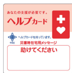
▲災害時メッセージシート

「ヘルプカード」は障害のある方が、日常生活や緊急時、災害時に周囲に手助けを求めるときに所持しているカードです。