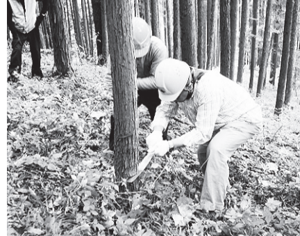
▲中央区の森体験ツアーの様子

地球温暖化対策として森林保全事業を実施している「中央区の森」で、間伐や植樹などを体験して、森林の大切さを考えてみませんか。 日 5月18日(日) ・集合 午前7時30分 区役所前 ・解散 午後6時(予定) [行先] 西多摩郡檜原村 対 区内在住・在勤・在学者(小学校5年生以上) ◎小学校5・6年生の参加の場合は、保護者が同伴し、保護者1名につき、2名まで参加可能 内 「中央区の森」での間伐や植樹体験(天候や交通状況により内容が変更になる場合があります) [持ち物] 弁当・飲み物・軍手 [服装等] 長袖・長ズボン・トレッキングシューズなどの厚底の靴 定 35名(申込多数の場合は抽選) 費 傷害保険加入料として200円 日 5月8日(木)までに電話で申込み(電子申請も可)。 問 環境推進課環境活動係 ☎(3546)5654