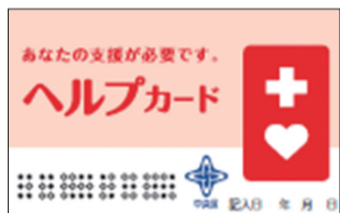
▲ヘルプカードのデザイン

「ヘルプカード」を提示され、相手には伝わっていないかを確認しながらゆっくり話し掛けてください。