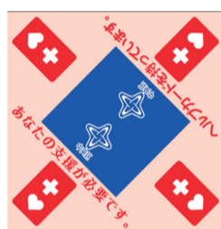
▲災害時支援用バンダナ