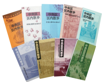
▲中央区区内散歩～史跡と歴史を訪ねて～(左上から第1～9集)