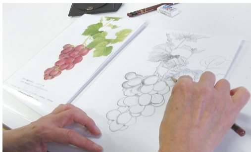
▲いきいき桜川「鉛筆画教室」の様子

区内3カ所にあるいきいき館(敬老館)では、高齢者の皆さんの健康づくり・仲間づくり・生きがいづくりの場としてさまざまなサービスの提供を行っています。誰もが楽しく過ごしていただけ身近な施設ですので、