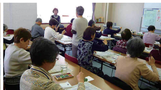
▲いきいき浜町「絵手紙教室」の様子