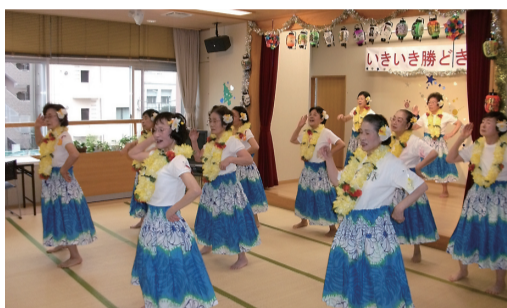
▲いきいき勝どき「フラダンス教室」の様子