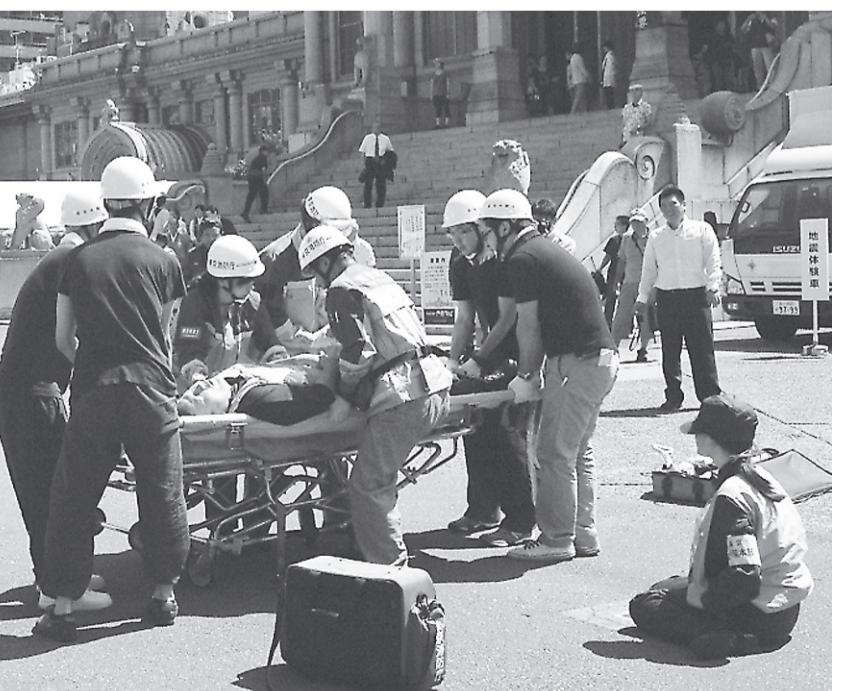
▲中央区総合防災訓練の様子

存建築物の省エネルギー対策を支援するほか、環境講座の実施と受講後のフォローアップを通じて、地域での環境活動の核となる人材や団体の育成および相互の交流を促進し、区民・事業者・区が一体となった取り組みを積極的に推進します。