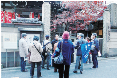
▲秋の「中央区」歴史散歩2013の様子

2月23日東京マラソンが開催され、約3万6千人が区内を駆け抜けました。コース沿道では、神田囃子、和太鼓の演奏、チアリーディングなどの応援イベントが行われ、ランナーに熱いエールを送っていました。また、観衆も寒空の下、「ファイト!」と温かい声援で力走を後押ししていました。