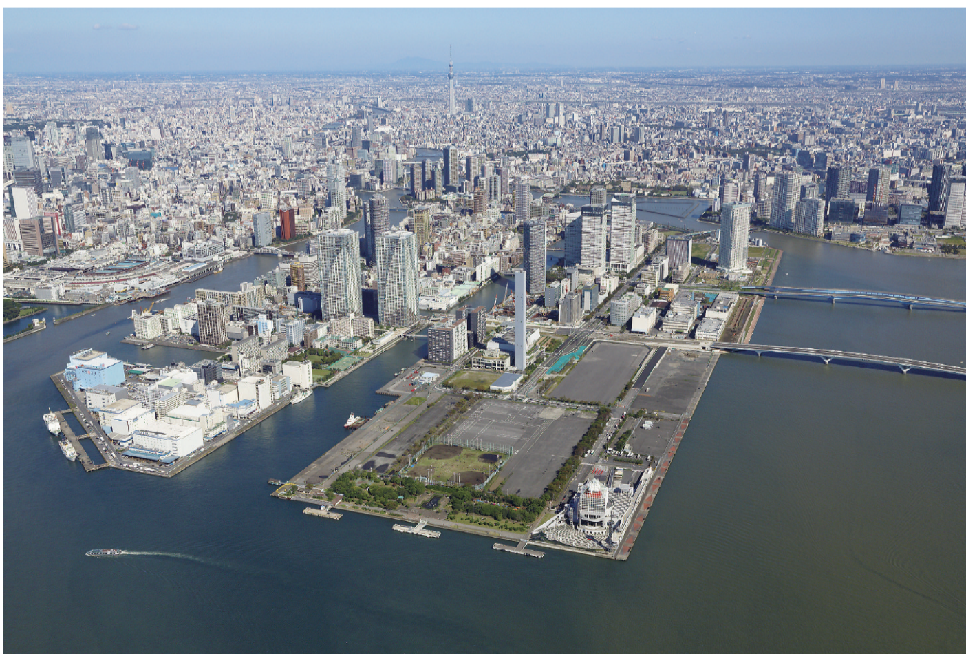
▲上空から望む晴海地区

この東京に、平和の象徴ともいえるべきオリンピックの聖火が再びともることになりました。昨年9月8日の早朝、IOC会長から「東京」の名が告げられた瞬間、固唾をのんで見守っていた多くの区民、都民、そして日本中の国民の緊張した面持ちは大きな笑顔へと一転し、開催地に選ばれた栄誉と感激を共に分かち合いました。世の中がいつぱんに明るくなった、日本を覆っていた閉塞感が一気に晴れ渡った、そんな感じがいたします。