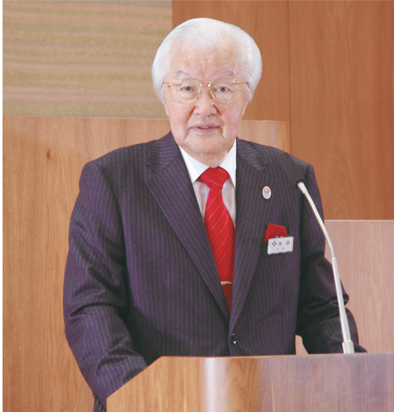
中央区長 矢田 美英

中央区ホームページ http://www.city.chuo.lg.jp (「区のおしらせ 中央」もご覧いただけます)