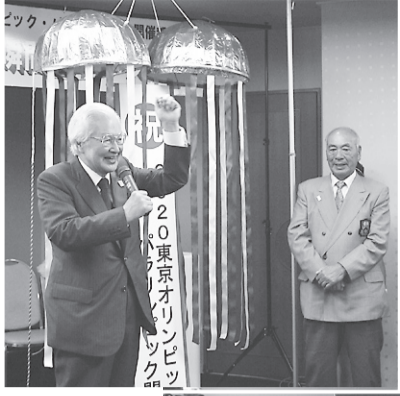
▶2020年オリンピック・パラリンピックの開催都市決定パブリックビューイング(晴海地区)