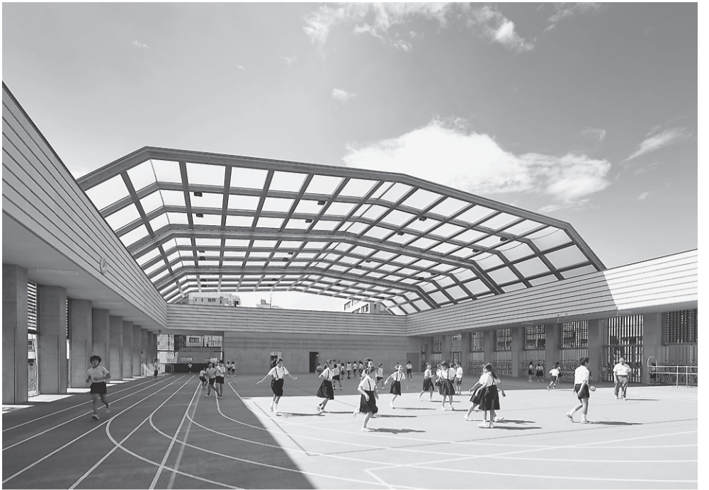
▲区立中央小学校・幼稚園(平成24年7月竣工)

商業融資では、150億円の融資枠を確保し、豊富な資金メニューを提供するとともに、消費税率引き上げに伴