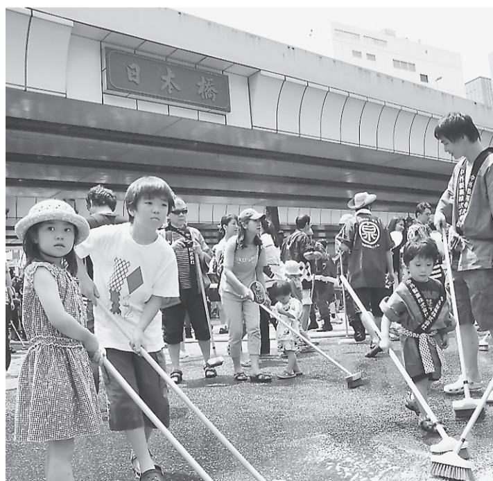
▲名橋「日本橋」橋洗い

重ねて区議会ならびに区民皆さま方のご理解とご協力をお願い申し上げ、所信表明といたします。