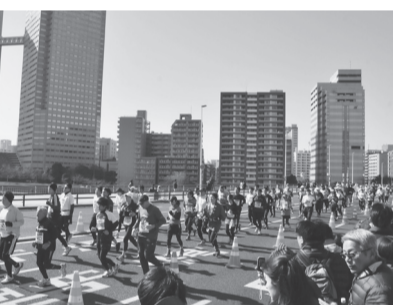
▲昨年の東京マラソンの様子

江戸バス一部運休のお知らせ 2月23日(日)当日の江戸バスは、次のとおり一部運休します。