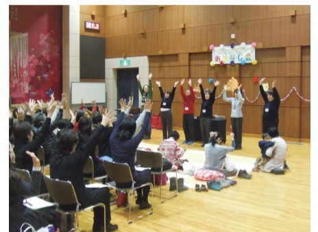
生涯学習サポーター養成コース「よみかかせボランティア養成講座」