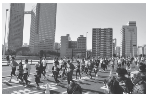
▲昨年の東京マラソンの様子

当日はマラソンコースを中心に長時間の交通規制別表1参照が行われます。また、自転車や歩行者のコース横断も規制されます。詳しくは、東京マラソン財団