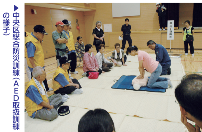
中央区総合防災訓練(AED取扱訓練の様子)

々がすべきこと」などについて講演を行います。皆さんの積極的な参加をお待ちしています。