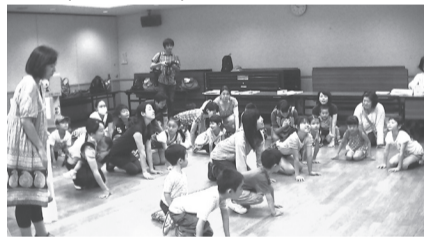
▲みんなで一緒に「ウサギのポーズ」

☑2月7日(金)から電話で申込み。 ☑〒104-0032 中央区八丁堀4-1-5 中央区社会福祉協議会ボランティア・区民活動センター ☎(3206)0560