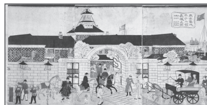
▲東京築地ホテル館表掛之図

場東京区政会館1階エントランスホール(千代田区飯田橋3-5-1、東京メトロ東西線「飯田橋駅」A5出口より徒歩1分) 問郷土天文館「タイムドーム明石」 ☎(3546)5537