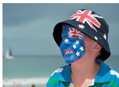
▲昨年度写真展での展示写真「オーストラリア・デー2012」

中央区文化・国際交流振興ホームページアドレス http://www.chuo-ci.jp/syashinten/ ☎(3297)0251