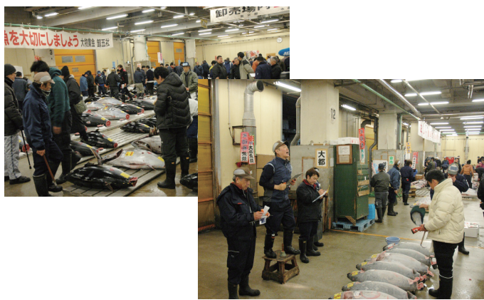
築地市場初市 (初せり)

1月5日早朝、築地市場で新春恒例の初市が行われました。マグロ卸売場では、卸売業者と仲卸業者の代表者があいさつし、手締めで商売繁盛を祈願した後、カランカランという鐘を合図に初せりが始まり、威勢のいい掛け声が響き渡る中、次々と競り落とされていました。