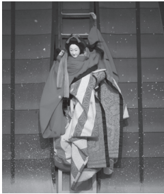
▲国立文楽劇場提供

【内】文楽は義太夫の語り和三味線、人形遣いの三業が心を合わせて一つの舞台を作り上げる総合芸術です。文楽の歴史や、名作の見どころ聞きどころについて知る講義のほか、太夫・三味線・人形遣いの技芸員によるお話や実演を交え、文楽について