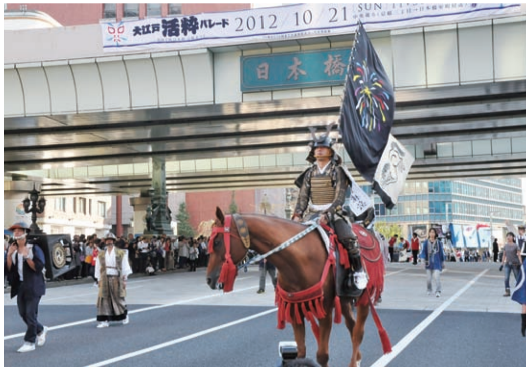
▲昨年の大江戸活粋パレードの様子

10月1日(火)から11月6日(水)まで、区内一円で観光商業まつりを開催します。 東日本大震災復興支援チャリティ・オーブンニングイベント 東日本大震災の復興支援を継続して行うため、募金をお願いするとともに、区内商店街などの名産品を配布します。各会場とも配布品がなくなり次第終了です。集まった義援金は、区を通じて石巻市に寄付します。また、各会場で第32代中央区観光大使・ミス中央を紹介します。 日時・会場 10月1日(火) ・主会場(八重洲地下街メイン・アベニュー)