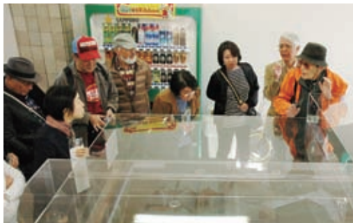
▲昨年の「まち歩きツアー」(伝馬町牢屋敷の模型見学と周辺散策)の様子

9月1日、京橋地域で総合防災訓練が実施されました。今年、女性などに配慮した避難所運営訓練や帰宅困難者対応訓練のほか、負傷者のトリアージや医療救護訓練も行われ、参加した皆さんは、災害に備え、お互いに声を掛け合いながら積極的に取り組んでいました。