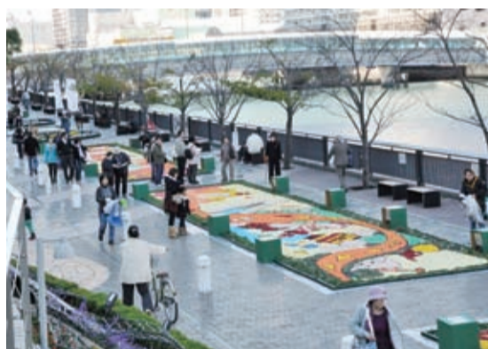
▲昨年の晴海フラワーフェスティバルの様子

午前11時、京橋会場(銀座三越9階銀座テラス) 午後0時30分、日本橋会場(トルナーレ日本橋浜町前) 午後1時30分、月島会場(晴海トリトンスクエア・グランドロビー) 午後2時30分、 くじ付きセール 日程 ・商店街・小売店 10月7日(月)~14日(祝) ・百貨店など 10月12日(土)~14日(祝) 内容 商店街・小売店は3千円、百貨店などは1万円お買い上げごとにスピードくじ1枚を