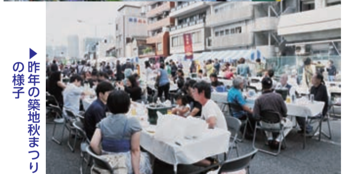
▲昨年の築地秋まつりの様子

内容 区内に店舗のある名店・老舗などが物販を行うとともに、ステージイベントを実施します。