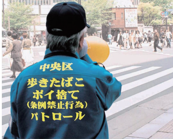
中央区歩きタバコ及びポイ捨てをなくす条例 平成16年6月1日施行 喫煙は吸い殻入れのある場所をお願いします。