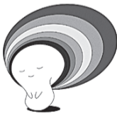
▲中央区社会福祉協議会イメージキャラクター「ニジノコ」