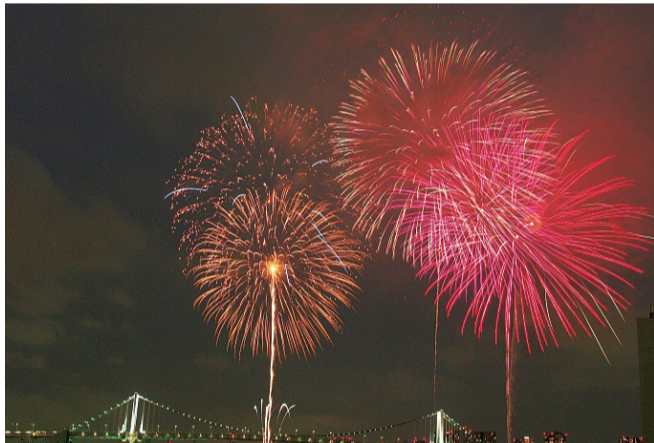
▲昨年の東京湾大華火祭

えさせていただきます。 ◎抽選の場合は区民優先となります。 ※問合せ先 東京湾大華火祭実行委員会事務局 入場整理券について ☎(3248)1561 ・その他華火祭全般について 地域振興課地域事業係 ☎(3546)5339