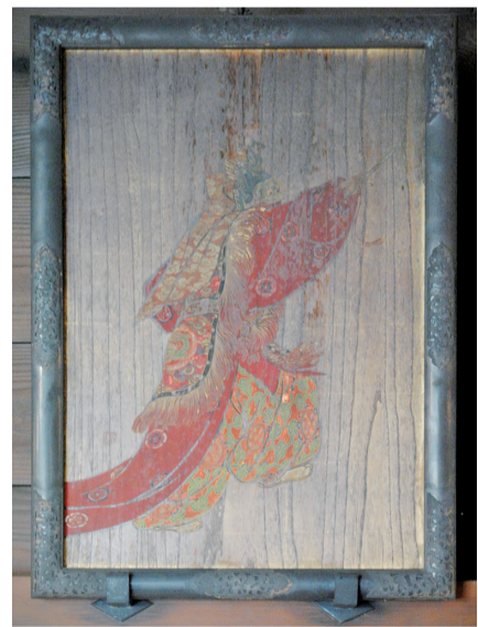
▶板絵着色蘭陵王図額

自然・人工の別はあるものの、私たちはさまざまに音に接しながら暮らしています。特に、音を組み合わせる表現した音楽は、時間的な性格を有する芸術として、いろいろな場所や場面で響き・聞き・感じることが出来ます。 「音楽」という言葉が、あらゆる音楽活動や形態の総称となったのは、音楽取調掛現在の東京藝術大学音楽学部の前身が文部省内に創設された明治12年(1879)以降のことです。古くは「天上の楽」やこれを模した「法会の舞楽」の意味で用いられ、明治初期でも宮内庁では「雅楽」の意味に限定していました。雅楽は、奈良・平安時代か