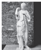
(アルテミス、通称「ギャビーのディアナ」)ローマ、ティベリウス帝時代(14-37年頃)

7月20日(土)から東京都美術館で開催される「ルーヴル美術館展 地中海四千年のものがたり」に関連する講演会「時空を超えた地中海への旅～ルーヴル美術館展の見どころ～」を開催します。