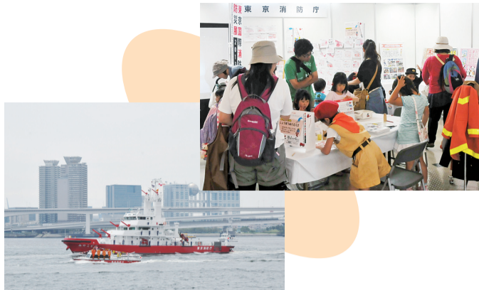
第65回東京みなと祭(5月25日・26日開催)

昭和16年5月20日の東京港開港を記念して東京みなと祭が晴海客船ターミナルおよびその周辺において開催されました。このイベントでは東京港に関連する団体のPRコーナーの他、新型消防艇「みやこどり」の一般公開などが行われ、多くの方で賑わっていました。