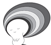
▲中央区社会福祉協議会イメージキャラクター「ニジノコ」