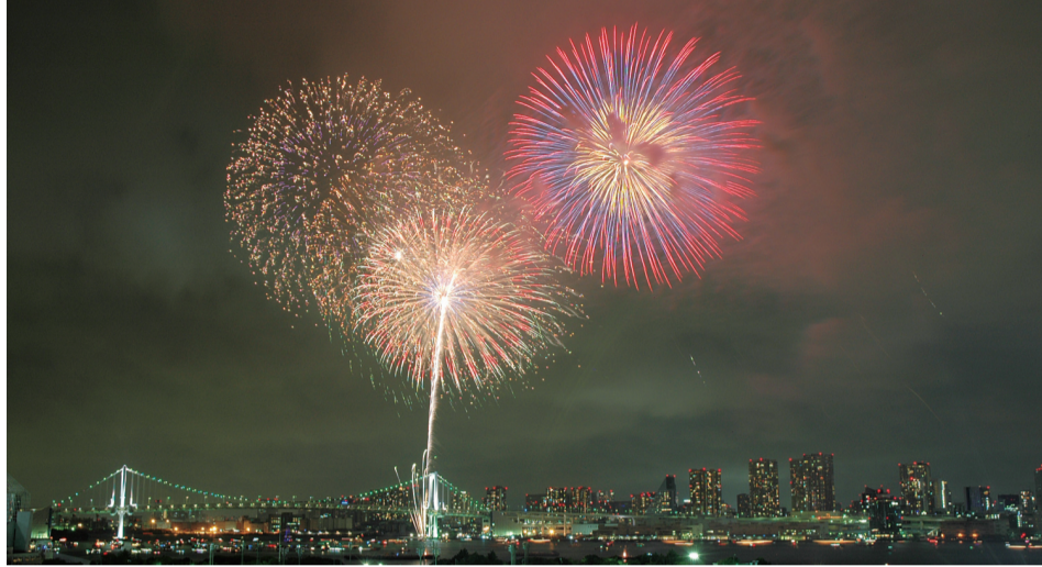
▲第24回東京湾大華火祭

中央区ホームページ http://www.city.chuo.lg.jp (「区のおしらせ 中央」もご覧いただけます)