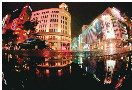
▲「水面の4丁目交差点」

販売場所 中央区観光協会(銀座1-1-25 京橋プラザ3階) 作品名 ・「気合いっぱい」 ・「水面の4丁目交差点」 ・「凱旋パレード」 ・「輝く地上絵」 ・「タイムスリップ」 ※問合せ先 中央区観光協会 ☎(6228)7907