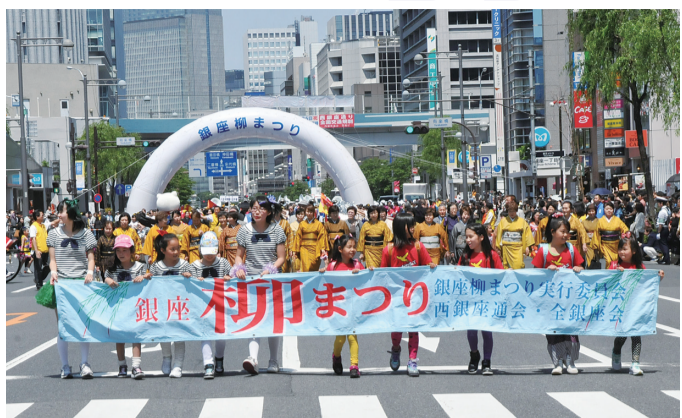
第7回銀座柳まつり

5月5日、西銀座通り(外堀通り)で「第7回銀座柳まつり」が開催されました。東京都吹奏楽連盟による「ゴールデンパレード」やふるさと観光PRキャンペーン、銀座の象徴でもある柳の苗木のプレゼントなどさまざまなイベントが行われ、銀座を訪れた大勢の人でにぎわいました。