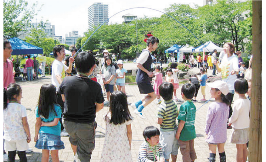
▲昨年の児童館まつりの様子

◎申込方法など詳しくは各児童館へお問合せください。 ◎乳幼児については、保護者同伴でご参加ください。 ◎各児童館では、ほかにもいろいろなイベントを予定しています。雨天の場合など、詳しくは各児童館にお問合せください。