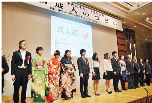
▲昨年度の新成人のつどいの様子

総務課総務係 ☎(3546)5234 所在地・園内については 浜離宮恩賜庭園 中央区浜離宮庭園1-1 庭園サービスセンター ☎(3541)0200