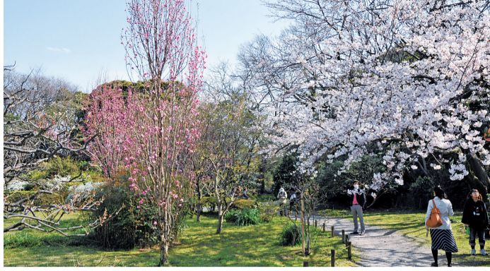
▼昨年4月頃の浜離宮恩賜庭園の様子

区民の皆さんに「浜離宮恩賜庭園」の素晴らしさを知っていただくため、5月6日(休)まで、無料で入園できます。桜のライトアップは行いませんが、期間中は開園時間を延長します。