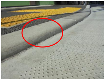
標準的な歩車道境界ブロックを使用した歩車道