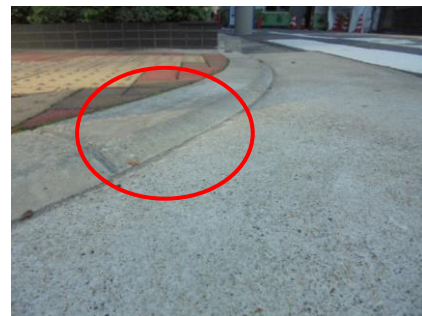
段差のない歩車道境界ブロックを使用した歩車道