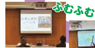
興味シンシン「築地と昆布 本当の話」