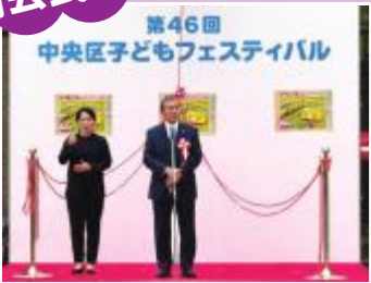
▲区長の開会あいさつ