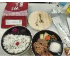
江戸の歴史を味わう…出汁を味わう講義の後は、今半のお弁当でランチ！