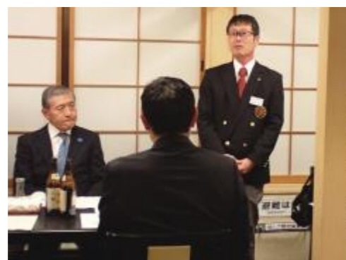
▲青少年委員会坂間会長