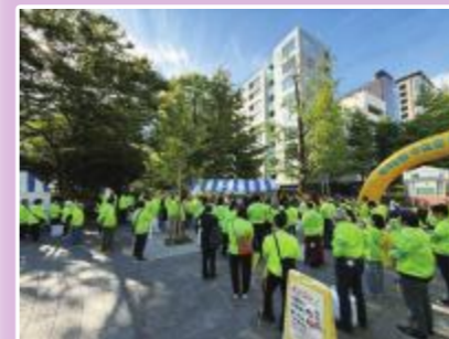
▲スタート前の打ち合わせで準備万全