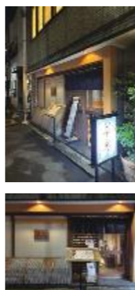
▲会場は月島の名店「草庵」さん