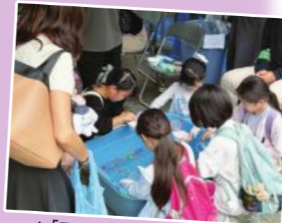
▲「スーパーボールすくい」大人気！