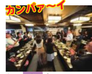
はじめは一本で！「おつかれさまでした」