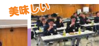
昆布を知り出汁を味わう！