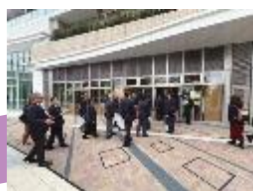
初日親睦のランチはHARUMI FLAG名店で