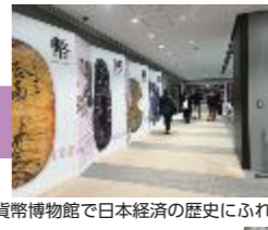
貨幣博物館で日本経済の歴史にふれる