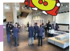
はるみらいから臨む新しい街なみ