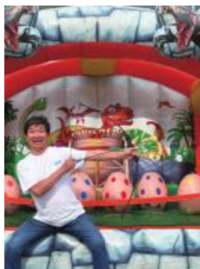
▼アーチェリーに挑戦！

運営に従事する青少年委員のメンバーも自らトライして大はしゃぎ（笑）青少年委員みんなが一丸となって、楽しく従事することができた有意義なスポーツの日でした。