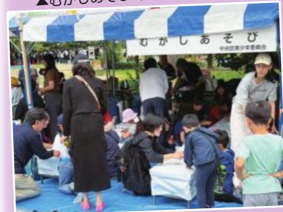
▲たくさんのご来場で満員御礼！