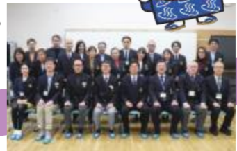
はるみらいには東京2020大会レガシーがいっぱい！