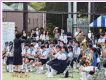
▲豊海小学校管楽器クラブ