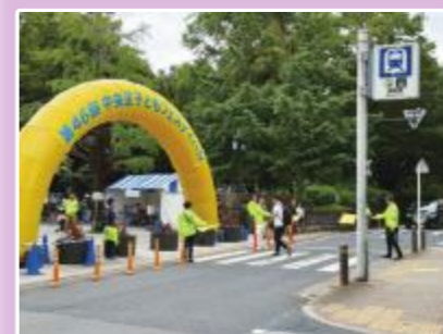
▲ご来場の皆さまの安全を管理！