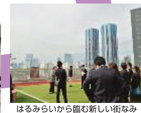
はるみらいから臨む新しい街なみ