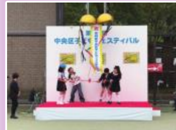
▲ポスター入賞児童によるくす玉割