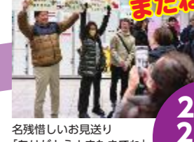
名残惜しいお見送り「ありがとう！またきてね」