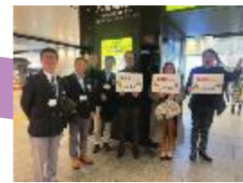
お迎えから盛り上げていきます「ようこそ中央区へ！」