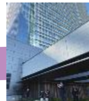
城東小学校校長によるご案内「ありがとうございました！」