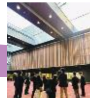
城東小学校視察「ビルを臨む全天候型運動場」