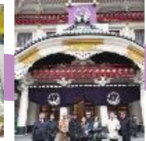
伝統芸能の殿堂「歌舞伎座」にて。ここでも歴史を堪能。