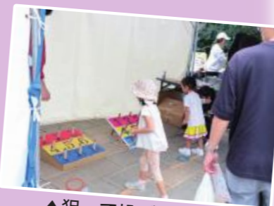
▲狙って投げて楽しい「輪投げ」