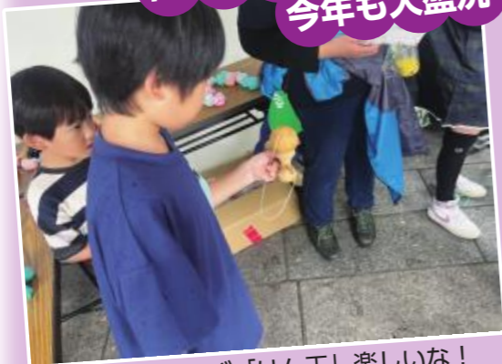
▲むかしあそび「けん玉」楽しいな！