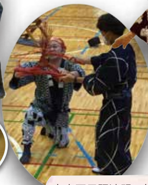
中央区民踊連盟の皆さま