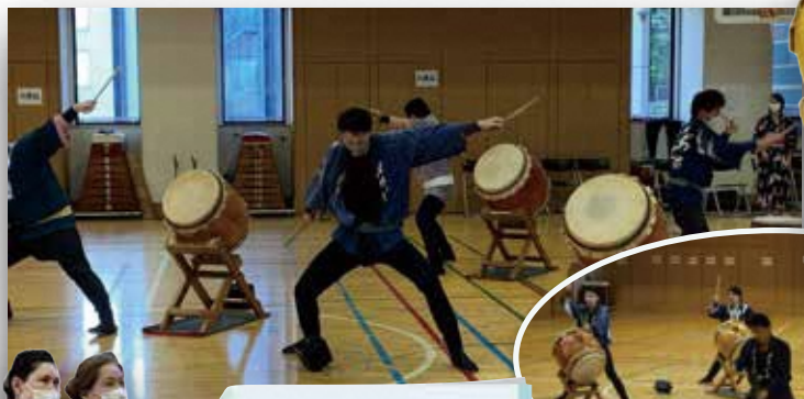
中央区太鼓連盟の皆さま