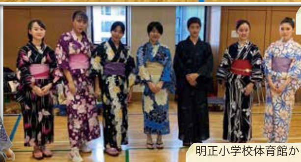
高校生・大学生 ボランティア