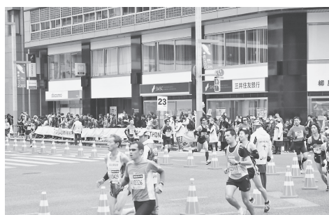
▲日本橋を走るランナー(昨年度)

種目 マラソンの部、10kmの部各種目ともに男子・女子・車いす男子・車いす女子があります。 スタート時刻(東京都庁前) 午前9時5分 車いすの部 午前9時10分 マラソン・10kmの部 主催 一般財団法人 東京マラソン財団 区内コース 区内マラソンコース図参照 ◎当日はマラソンコースを中心に長時間の交通規制別