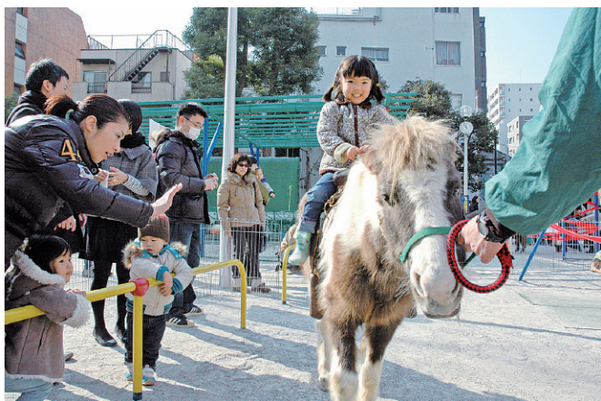
▲ミニ動物園ではポニーや小動物たちとふれあえます

内容 9日 午前11時30分 特設ステージで雪まつりの開幕を告げます。 雪遊びコーナー 勇気を出して雪のスロープ