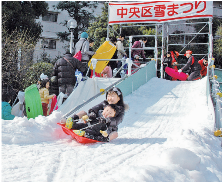
▲第16回中央区雪まつりの様子

友好都市の山形県東根市から届けられた雪で、会場のあかつき公園は一夜にして銀世界に早変わりします。 地域の方のご協力による雪遊びコーナーや、東根名物「いも煮汁」、「玉こんにゃく」などが味わえる味コーナーで、会場内は元気と熱気で満ちあふれます。 子どもは風の子。友達を誘ってみんなで思いっきり雪遊び。寒さなんか吹き飛ばそう。