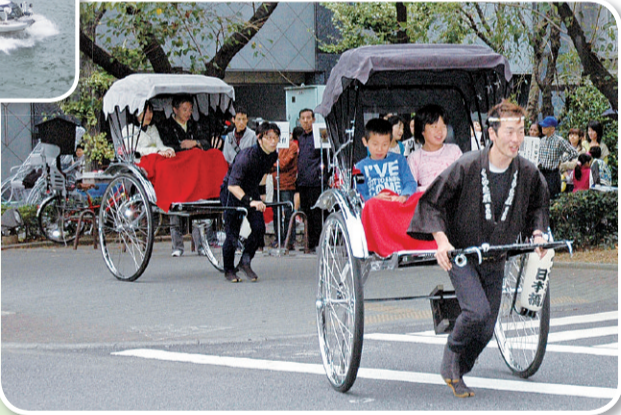
日本橋人形町を巡る人力車体験