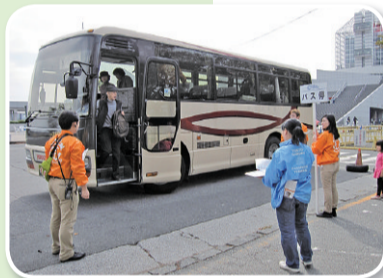
イベント当日、バスが無料運行します