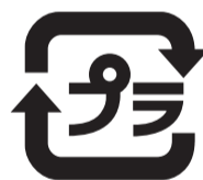
別図 プラスチック製容器包装

※明正小学校については、改築工事のため、越前堀児童公園で実施しています。 ◎回収品目 ・小学校および銀座・日本橋中学校…牛乳パック・食品用トレイ・布類・廃食用油・蛍光管・乾電池(同時に園芸用土の回収も行っています) ・ほっとプラザはるみ…布類