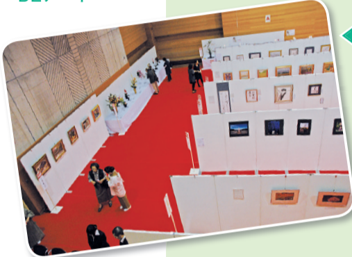
区民サークルなどの皆さんが日頃の成果を発表する中央区民文化祭作品展

名所・旧跡をはじめ、画廊・美術館、水辺など豊かな文化環境に恵まれている中央区。無料で運行するバスや船(別表1参照)に乗って区内を巡り、中央区の持つ文化をすみずみまで堪能してください。当日は、中央区コミュニティバス江戸バスも無料で乗車できます。 ◎当日のイベントの内容は2頁別表2のとおり ◎まるごとミュージアムの各イベントの内容を詳しく紹介するパンフレットを区施設などで配布していますので、ぜひご覧ください。また、中央区まるごとミュージアム2012ホームページも、併せてご覧ください。