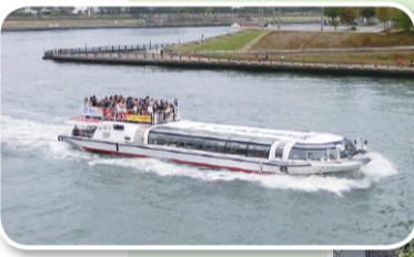
イベント当日船が3ルート無料運行します