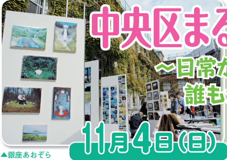
銀座あおぞら DEアート