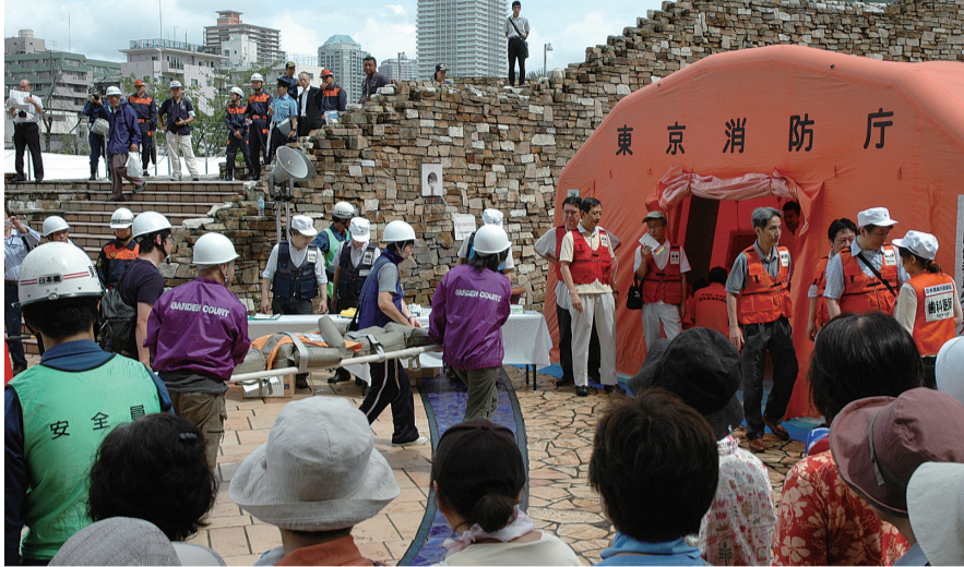
▶平成23年度総合防災訓練の様子