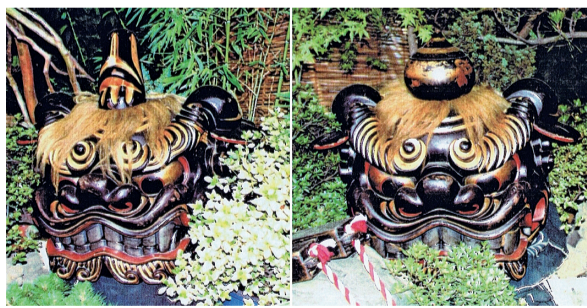
▲黒駒の獅子頭(左:雄獅子・右:雌獅子)

スポーツ課体育施設係 ☎(3546)5529 公共施設予約システムホームページアドレス パソコン用 http://yoyaku.city.chuo. lg.jp/web/ 携帯用 http://m-yoyaku.city.chuo. lg.jp/mobile/