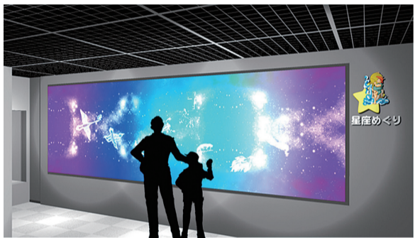
▲「星座めぐり」コーナー(イメージ)

タイムドーム明石では、「星座についてもっと知りたい」「自分の星座を見てみたい」にお応えします。プラネタリウムでおなじみの、ずばり「星座」をテーマに、その歴史や星占い十二星座などについて、資料・パネルの展示を中心に、映像、体験コーナーなどを交えて、夏休み特別企画を開催します。