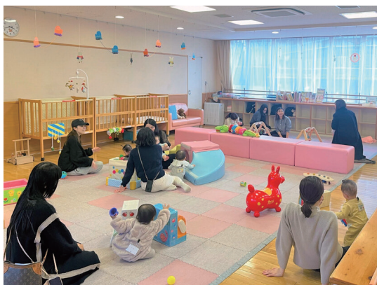
勝どき分室(子育て交流サロン「あかちゃん天国」)