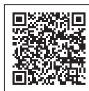
【病児・病後児保育】