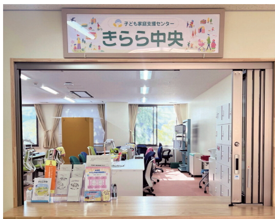
きらら中央(明石町)受付窓口

きらら中央(明石町)、勝どき分室 祝日・年末年始 日本橋分室、十思分室 土曜日・日曜日・祝日・年末年始