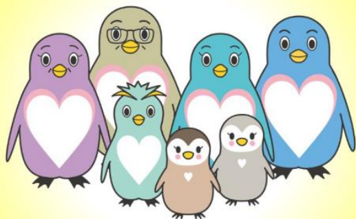
東京都里親制度PRキャラクター「さとペン・ファミリー」