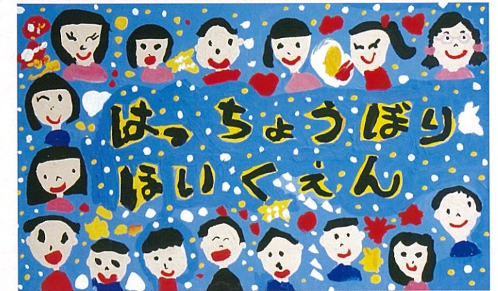
令和元年度 チャレンジ 卒園製作