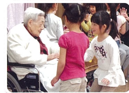
特別養護老人ホーム 「マイホームはるみ」との交流