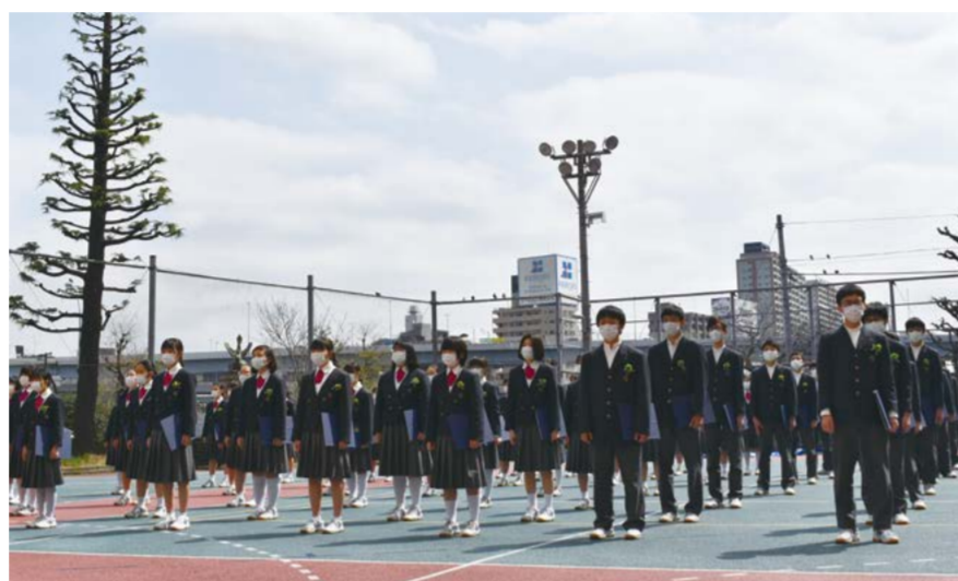
▲青空の下で合唱する生徒(日本橋中学校)