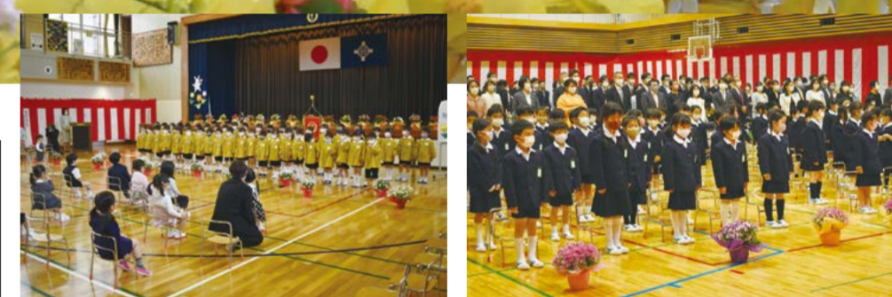
▲お祝いの言葉と歌(月島第二幼稚園)