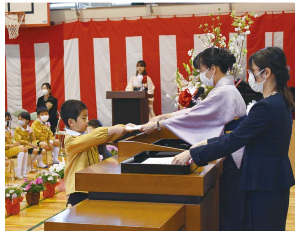
▲修了証書を受け取る園児(久松幼稚園)

3月18日(木)に幼稚園の修了式、19日(金)に中学校、24日(水)に小学校の卒業式が執り行われました。これまでの学校・幼稚園生活での思い出を胸に、新しい環境でも皆さんらしく輝いてください!