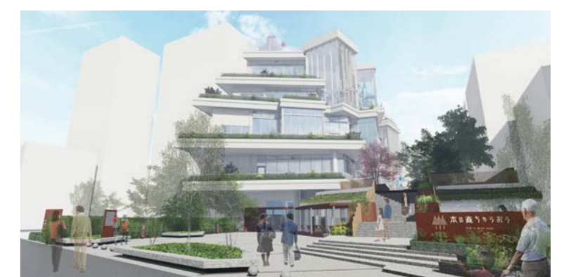
▲本の森ちゅうおう(仮称) パース図

用でき、歴史・文化を未来へ伝える地域の生涯学習拠点として、「本の森ちゅうおう(仮称)」を整備します。 今年度は区や地域に関する情報に加え、本区の歴史や文化などの情報を多角的に発信するためのICT機器の整備や郷土資料館の展示製作を行います。 *整備地 新富一丁目13番 *施設内容 図書館、郷土資料館 *スケジュール 平成29・30年度 基本設計・実施設計 令和元年度～4年度 建設工事 令和4年12月開校(予定)