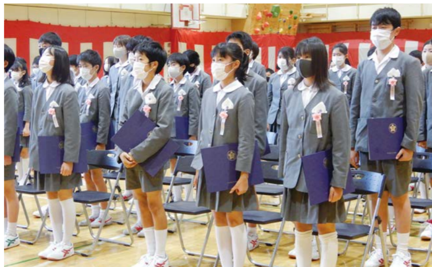
▲卒業式の様子(月島第一小学校)