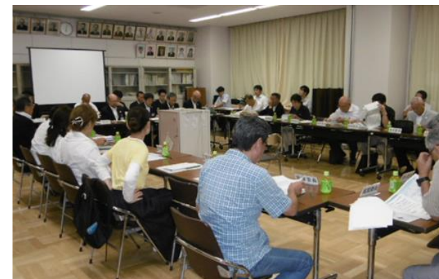
第5回協議会 当日の様子

基本設計(案)をまとめましたので、今後はより詳細な実施設計へと進めていくこととなり、平成31年度末までに実施設計をまとめる予定です。平成32年の東京2020オリンピック・パラリンピック大会が終わり選手村関連施設が解体され、平成33年度から建設を始め平成35年4月の開校を目指します。