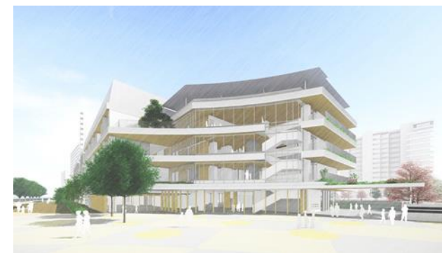
地区広場側外観イメージ