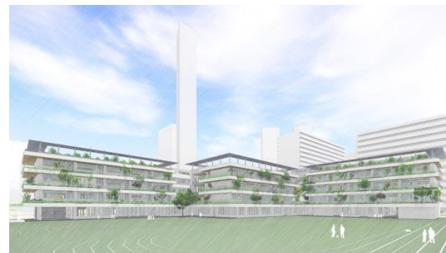
校庭側外観イメージ