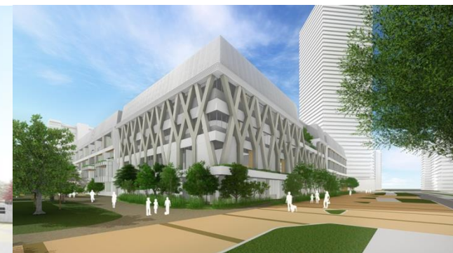
貫通路側外観イメージ