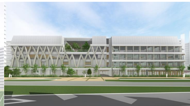
賑わい軸の中心側外観イメージ