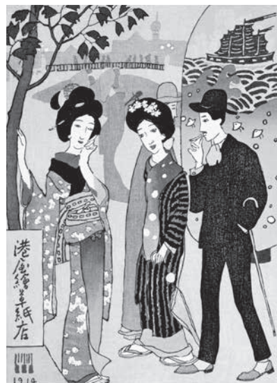
港屋絵草紙店（復刻木版画）