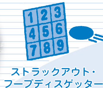
ストラックアウト・フープディスゲッター