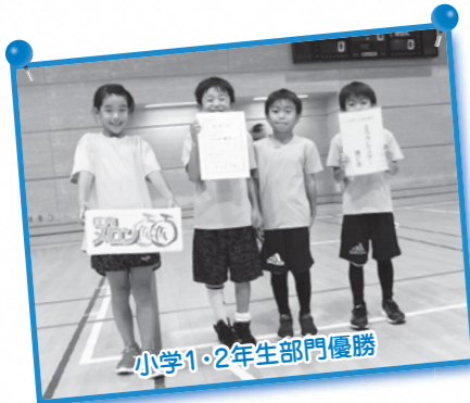
小学1・2年生部門優勝