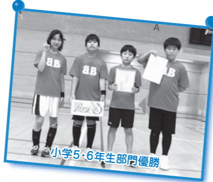
小学5・6年生部門優勝

第15回中央区キンボールスポーツ大会(ウィンターカップ)が2019年2月11日(月・祝)、区立総合スポーツセンターで開催決定！ 詳細については区民部スポーツ課までお問い合わせください。TEL:03-3546-5529