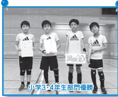
小学3・4年生部門優勝