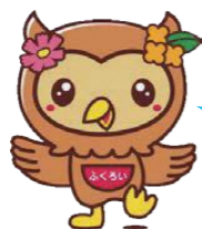
マスコットキャラクター「フッピー」

それぞれの活動報告やコロナ対策などを意見交換しました！ コロナの影響で延期が続きやっと開催できた発表会・意見交換会はとても有意義な会となりました。