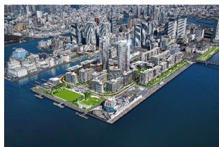
大会後の晴海地区のイメージ