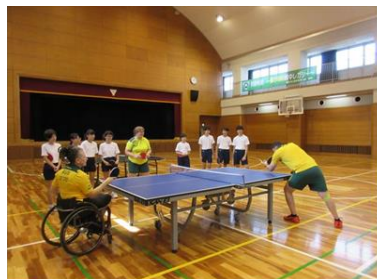
オーストラリア選手との交流