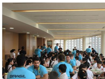
ブラジル選手との交流