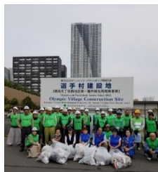
おもてなし清掃の様子