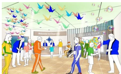
晴海おもてなし拠点（仮称）のイメージ