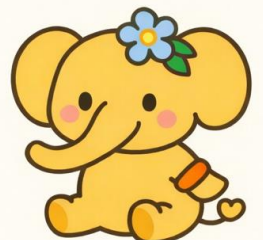
認知症支援キャラクター 「メモリん」

開催日時や会場など変更になる場合があります。 また、カフェによって活動内容が異なりますので、 詳細は直接お問い合わせください。