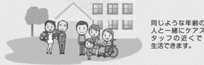
※施設の種類やケアプランによって支援内容が異なります。