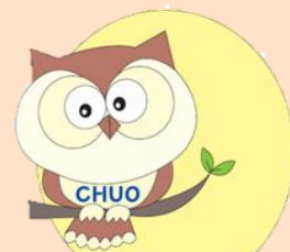
見守りキャラクター マモちゃん

通常業務の中で気づいた高齢者の異変を、お近くの「おとしより相談センター」へご連絡いただくだけです。連絡を受けたおとしより相談センターは、状況を確認し、必要に応じて支援をしていきます。