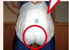
はいた後に引き上げた状態